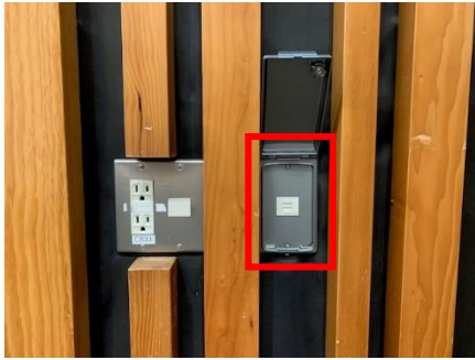
【7階シビックホールステージ側壁面】